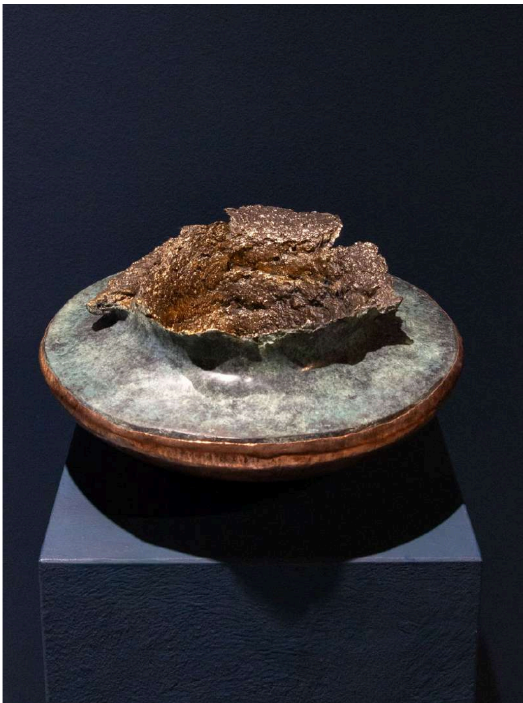
Strepitus 2025 bronzo e rame/ bronze and copper cm 34x34x18h € 6.000