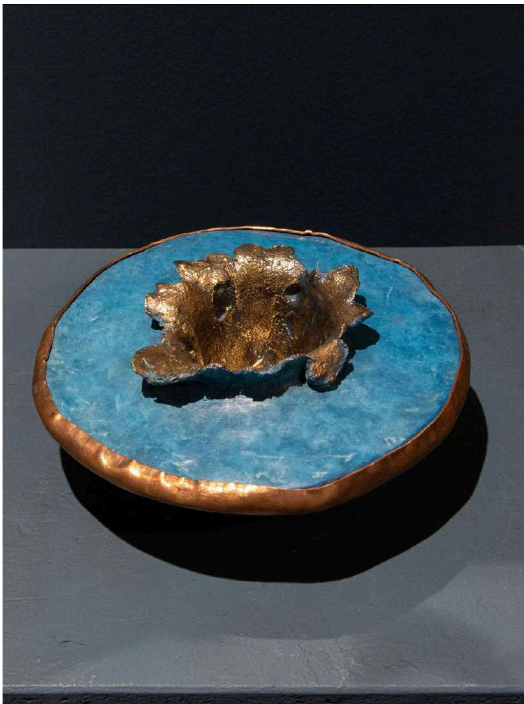
Solis caelum 2025 bronzo e rame/ bronze and copper cm 20x20x9h € 2.500