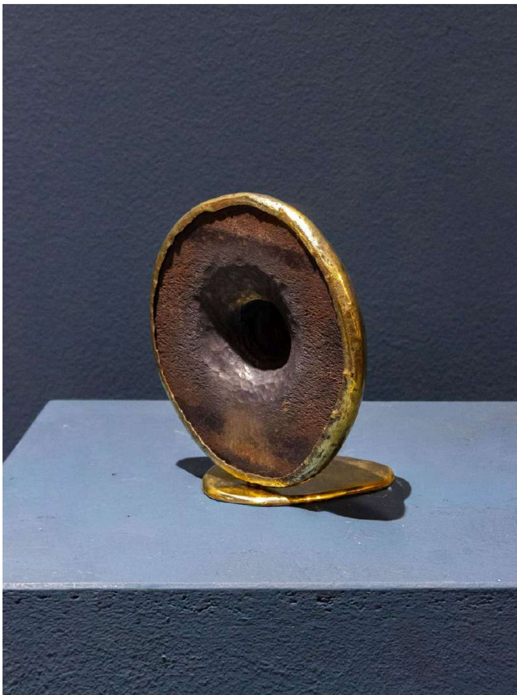
Profondo 2024 acciaio forgiato e ottone / forged steel and brass cm 16x18h € 2.000