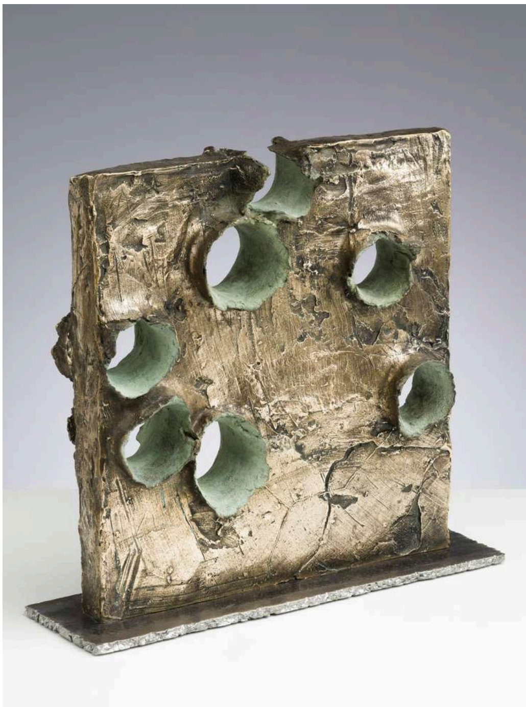
Polimpatto XY 2024 bronzo e acciaio / bronze and steel cm 41x11x38h € 8.000