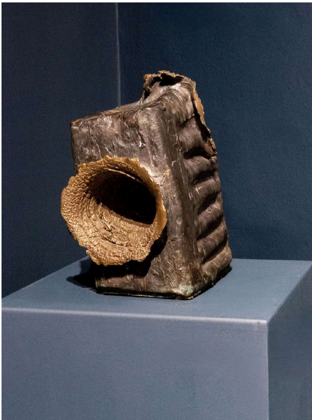
Pano 2008 bronzo cm 49x32x47h € 5.000