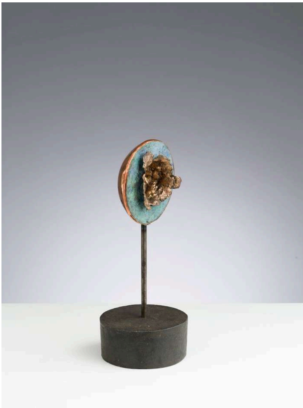
Root I 2024 bronzo, acciaio, rame / bronze, steel, copper cm 17x36h € 3.500