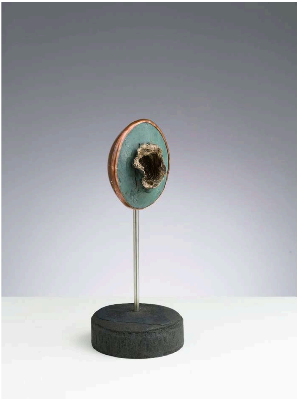
Root III 2024 bronzo, acciaio, rame / bronze, steel, copper cm 17x36h € 3.500