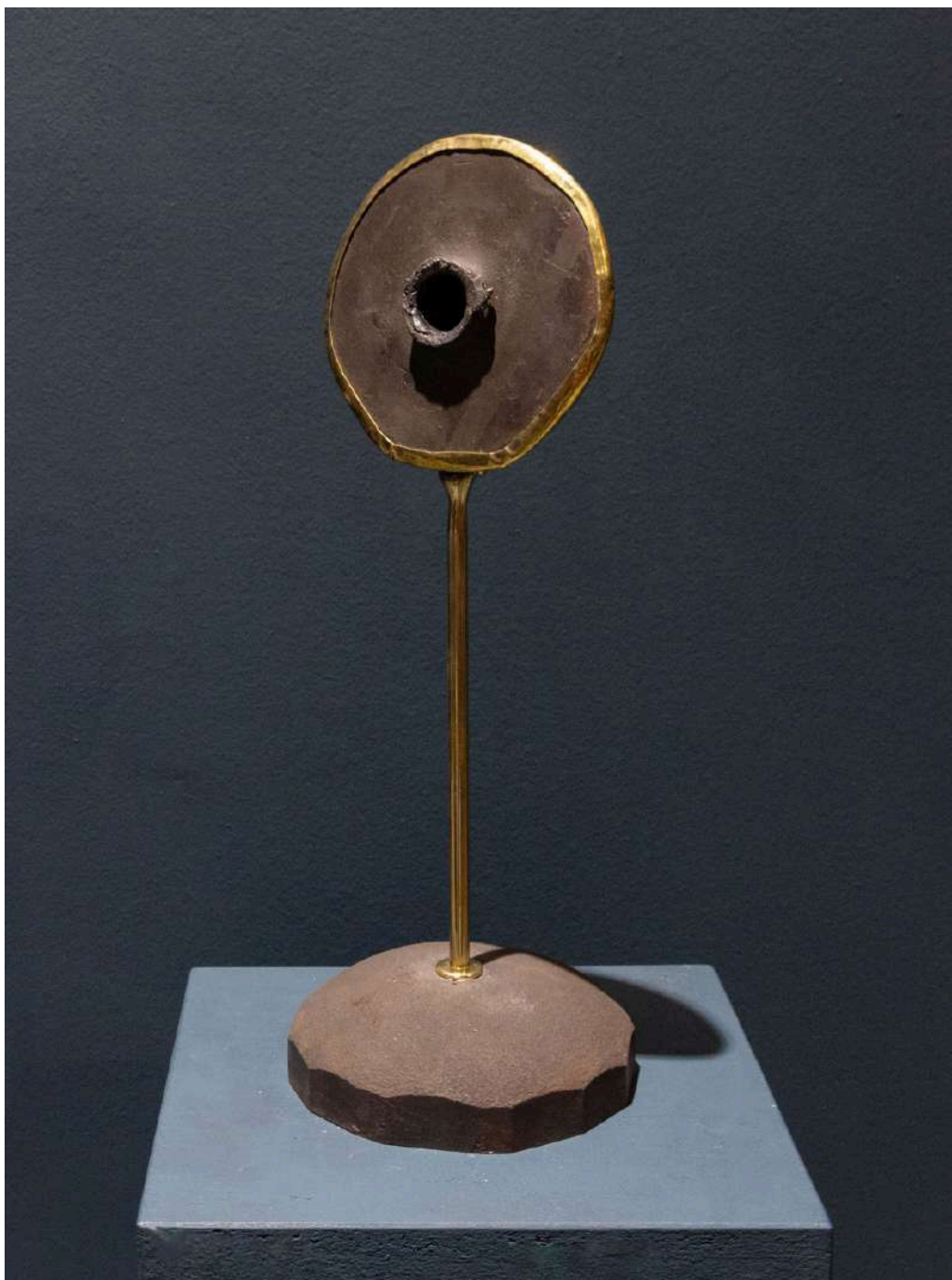
Evertere 2025 acciaio forgiato e ottone / forged steel and brass cm 17x17x48h € 3.000