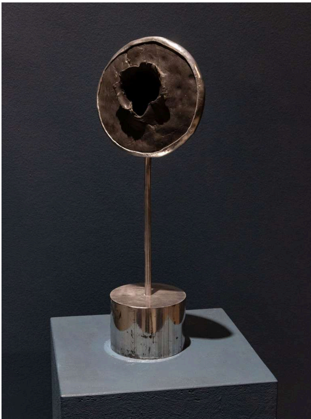
Levitas 2025 bronzo e acciaio/ bronze and steel cm 17x12x47h € 3.500